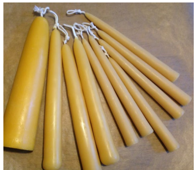
Bienenwaxkerzen in unterschiedlichen Größen

Die Schüler können zum Abschluss ihre Kerze mit einem Namensschild versehen. Die Kerze muss nun völlig abkühlen, bevor sie – in ein Butterbrotpapier gewickelt – mit nach Hause genommen werden kann.