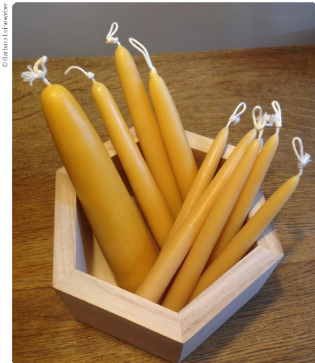
Selbst hergestellte Bienenwachskerzen