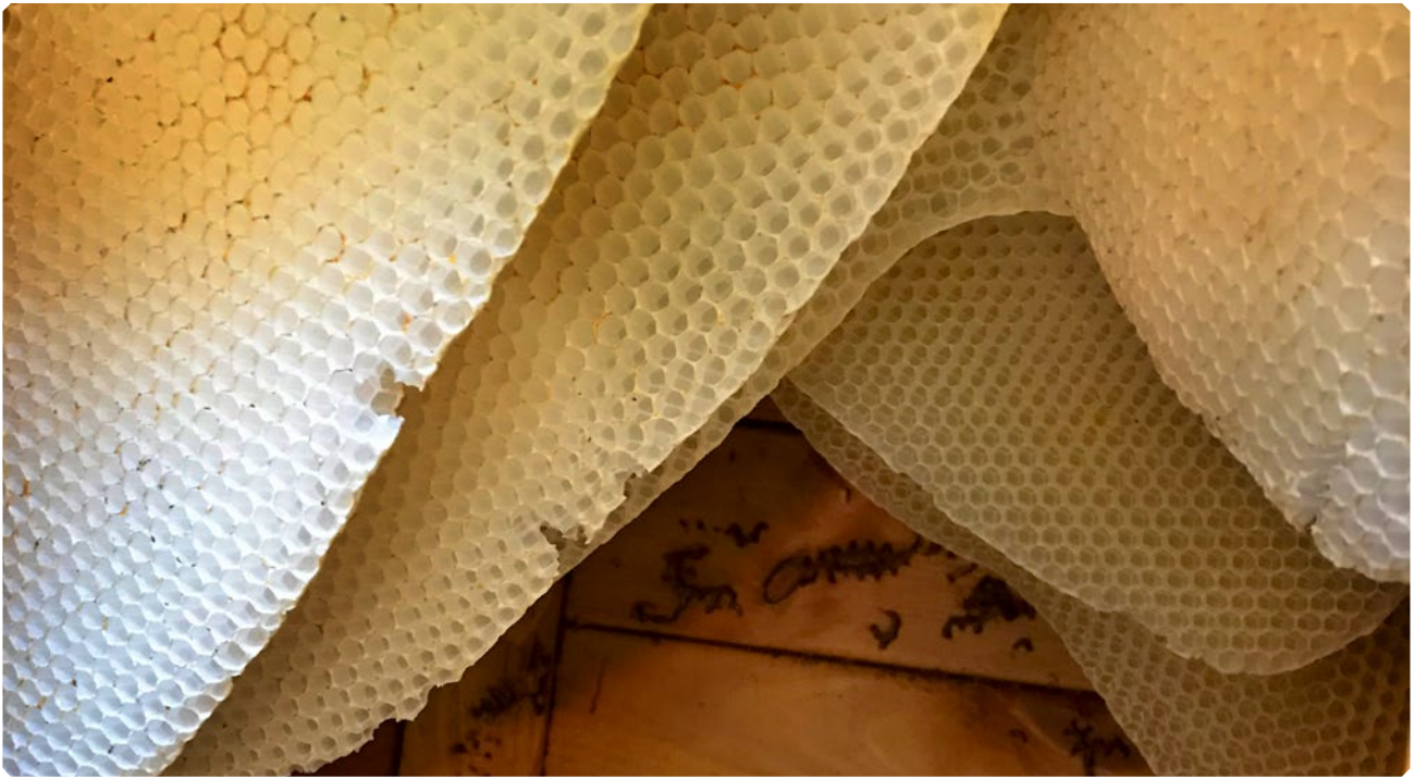
Vorher: Bienenwachs als Naturprodukt